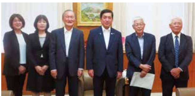
鹿児島県知事訪問