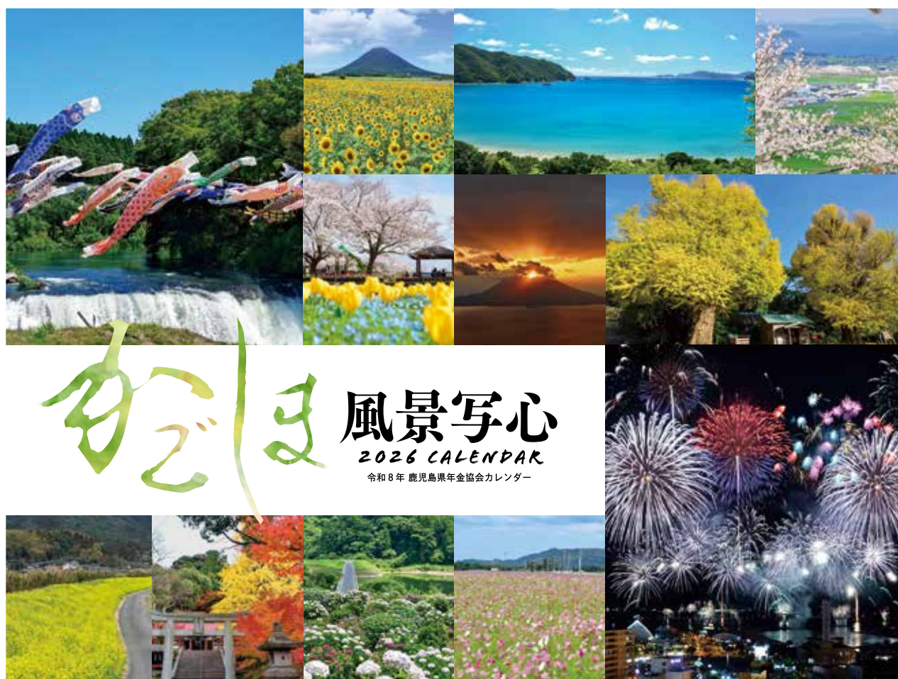
2026年度 年金協会オリジナルカレンダー表紙