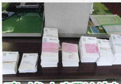
プレゼント応募はがき