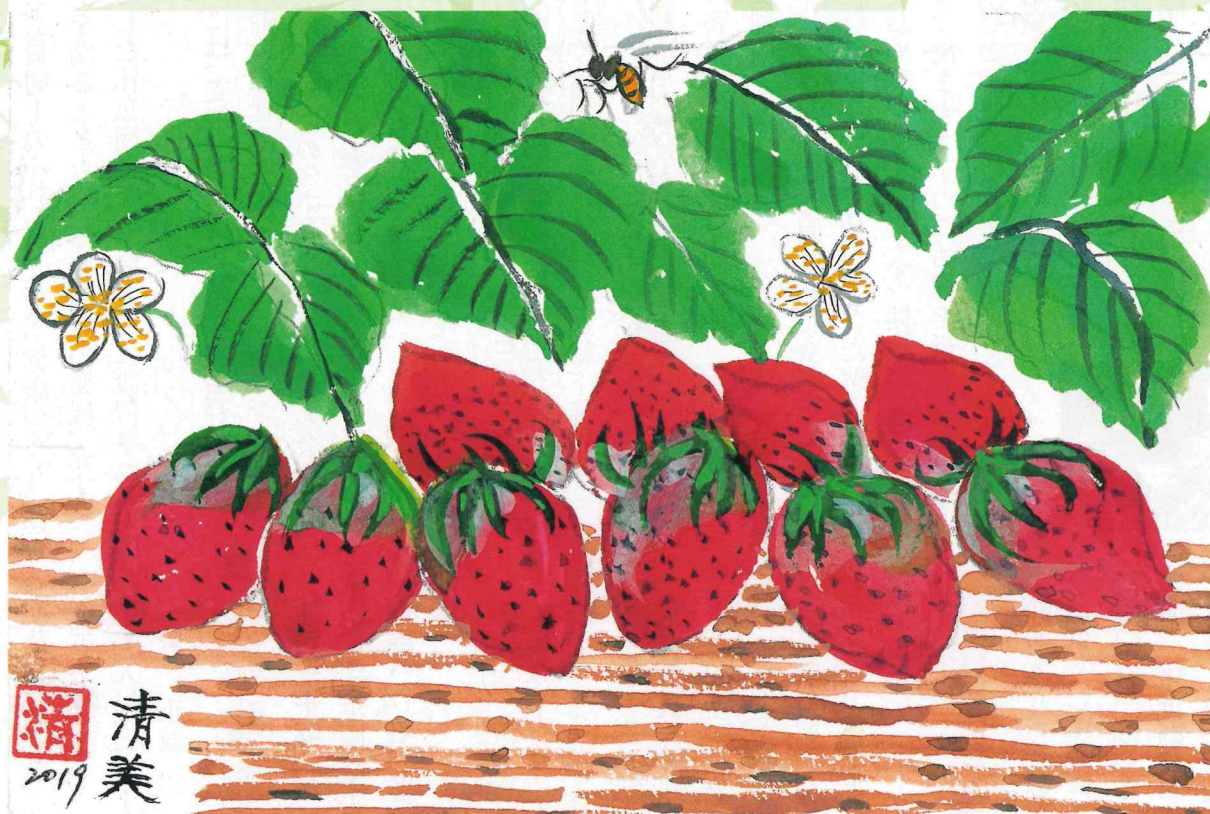
「イチゴ」前屋 清美 会員 作