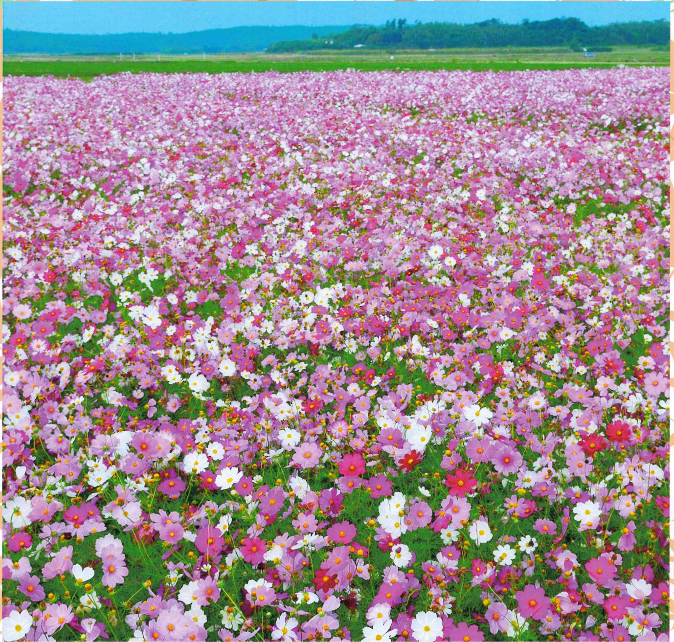
南さつま市金峰町「コスモス畑」