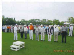
鹿児島支部 GG 大会表彰式

第10回ゴルフコンペが南国カンツリークラブで開催されました。回を重ねる毎に参加者も多くなり73名で熱のこもった大会になりました。 最高年齢 92歳 1名、80歳代 21名、70歳代 31名、69歳以下 20名 参加会員お疲れ様でした。次回を楽しみに精進ください。 グロス…80台 18名、90台 28名、100台 23名、110台 4名