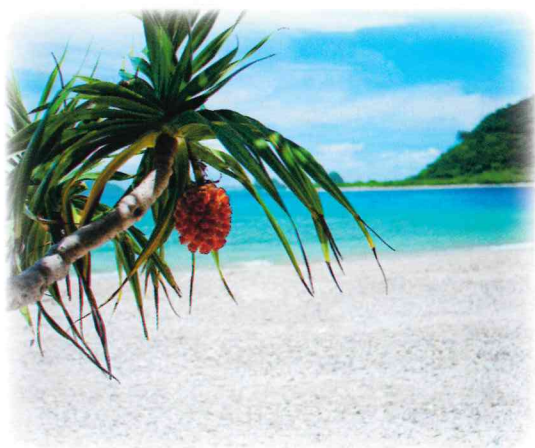
奄美市「アダンと海岸」