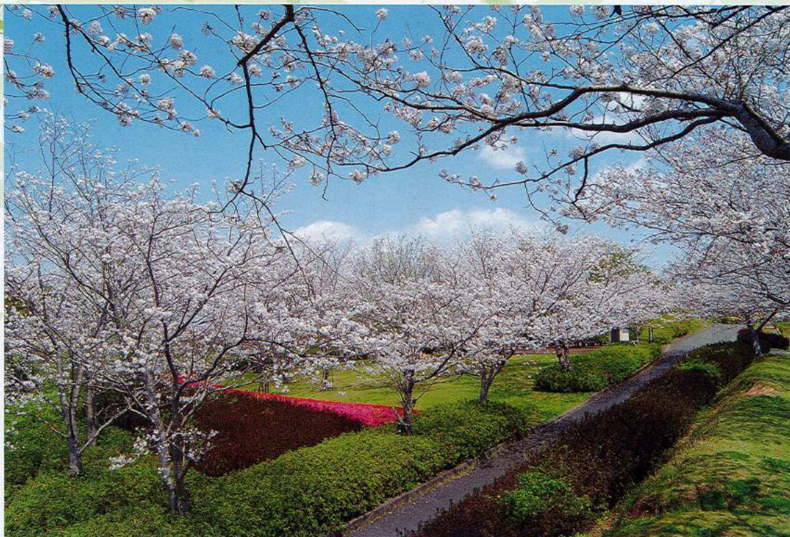
錦江湾公園「桜並木」