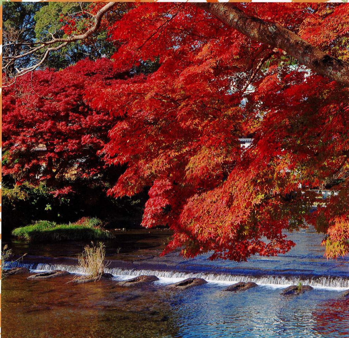
南九州市「市役所前紅葉」