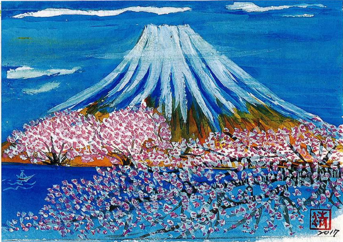
絵「富士山と桜」 前屋 清美 会員作