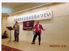
奄美大島 奄美サンプラザホテル