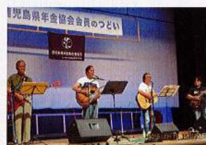
南薩 加世田いにしへホール