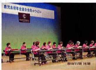
大隅 鹿屋市文化会館