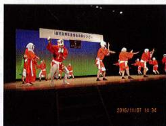
鹿兒島 谷山サザンホール