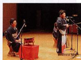
西薩 薩摩川内市国際交流センター