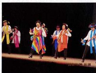
鹿兒島 宝山ホール