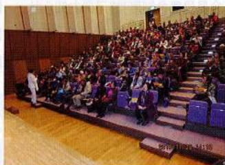
北薩 加治木加音ホール