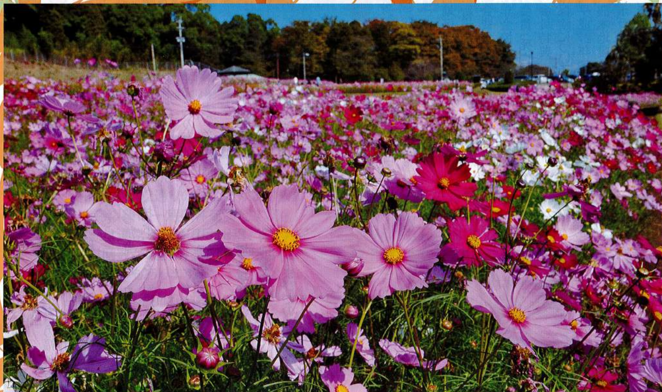
鹿児島市「慈眼寺公園のコスモス」