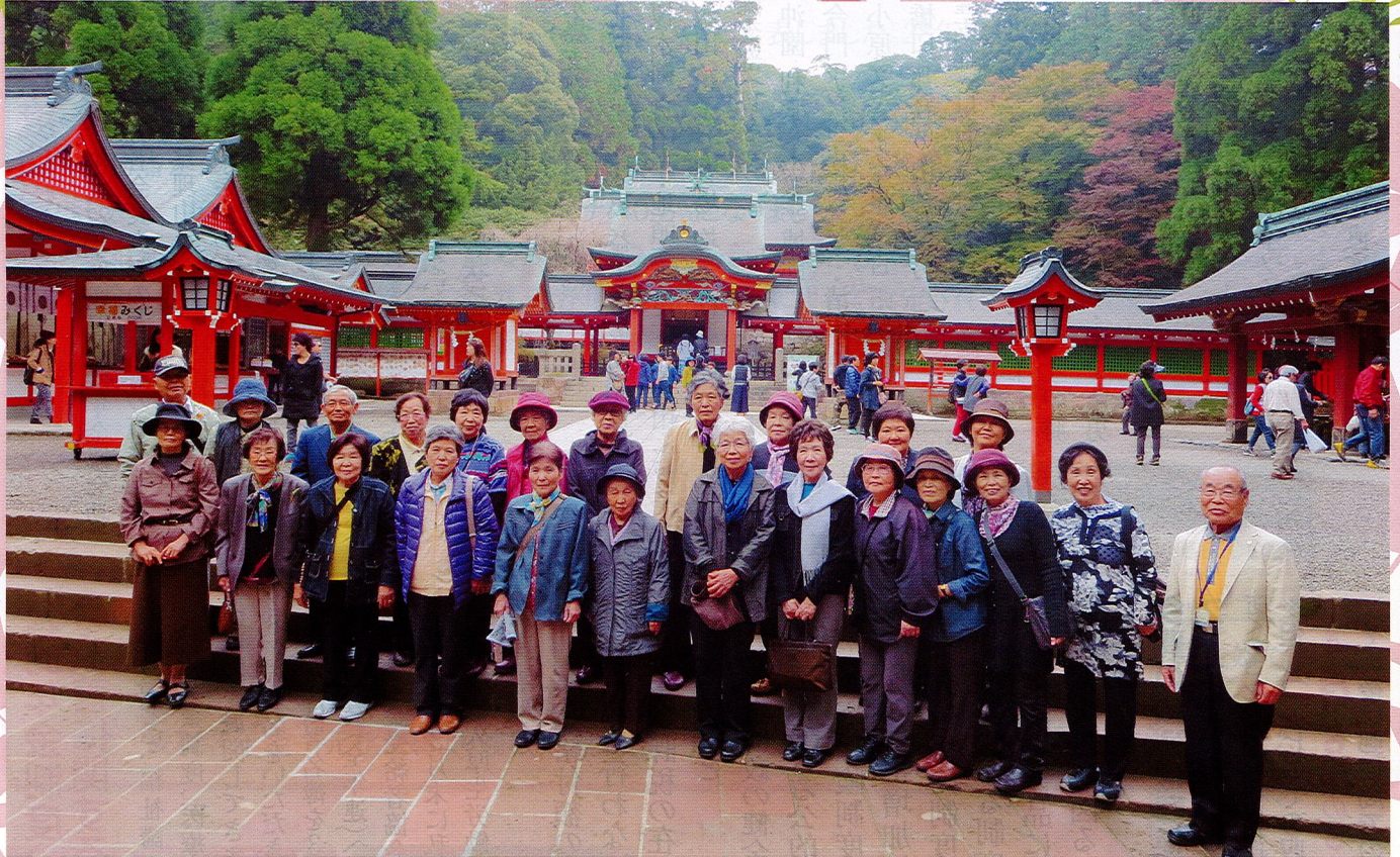
紅葉狩バスツアーで霧島神宮にて撮影