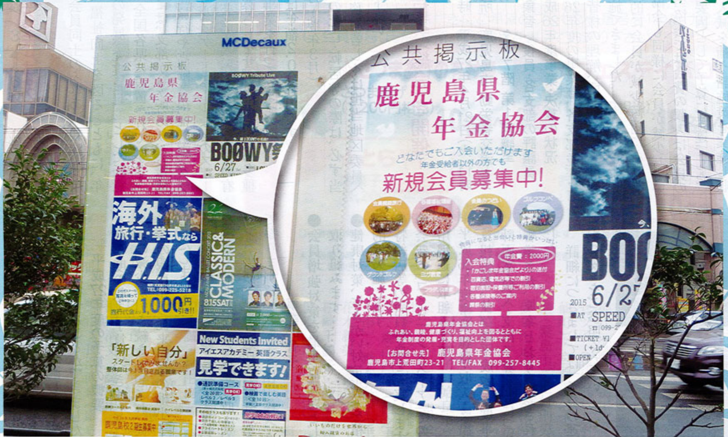
鹿児島市「公共掲示板」