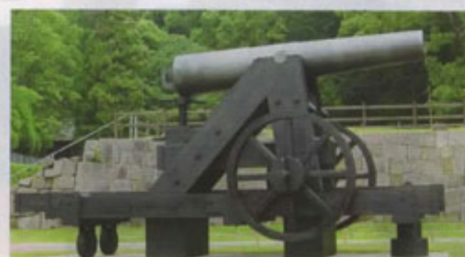
薩英戦争で使用した150ポンド砲(復元) 仙巖園