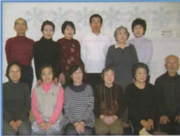
水曜日コースのみなさん (3名ご欠席でした)