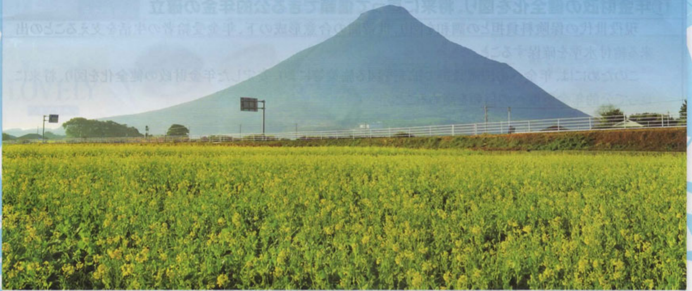
指宿市「菜の花ロード」