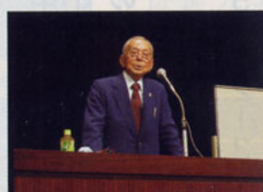
▲谷山サザンホール