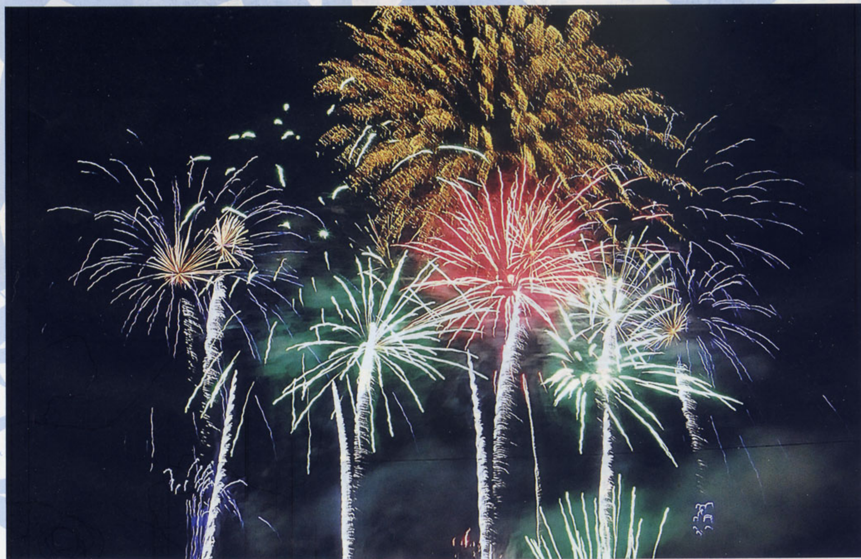
8月 「サマーナイト 大花火大会 鹿児島市」

〒890-0055鹿児島市上荒田町23-21 TEL FAX 099-257-8445 http://www.k-nenkin.com