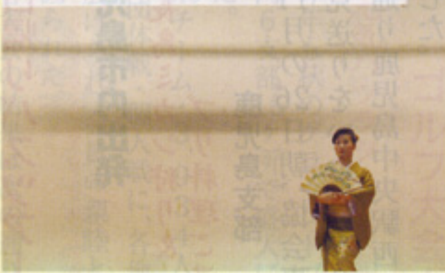
祝いの舞「英翠信峰」 南薩支部