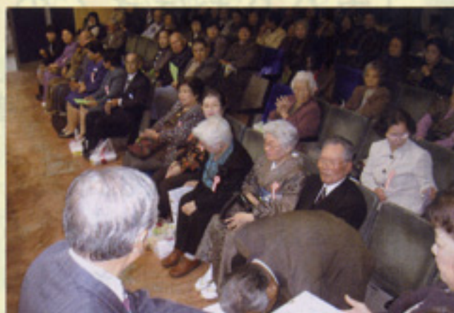
金婚式を迎えられた会員ご夫妻のお祝い 16組 奄美大島支部