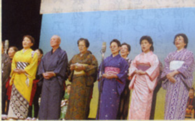
歌 うぐいす会一同 鹿児島支部谷山