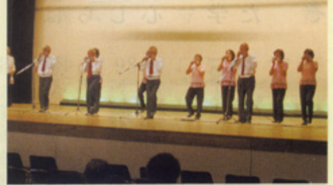
ハーモニカ&創作ダンス 南薩支部