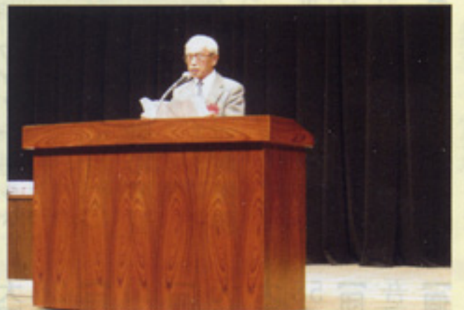
大会決議文宣言 鹿児島川口委員