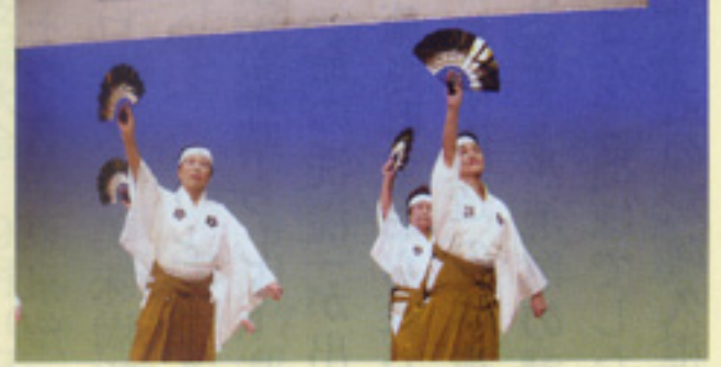
おどり「古城の舞」 鹿児島支部谷山