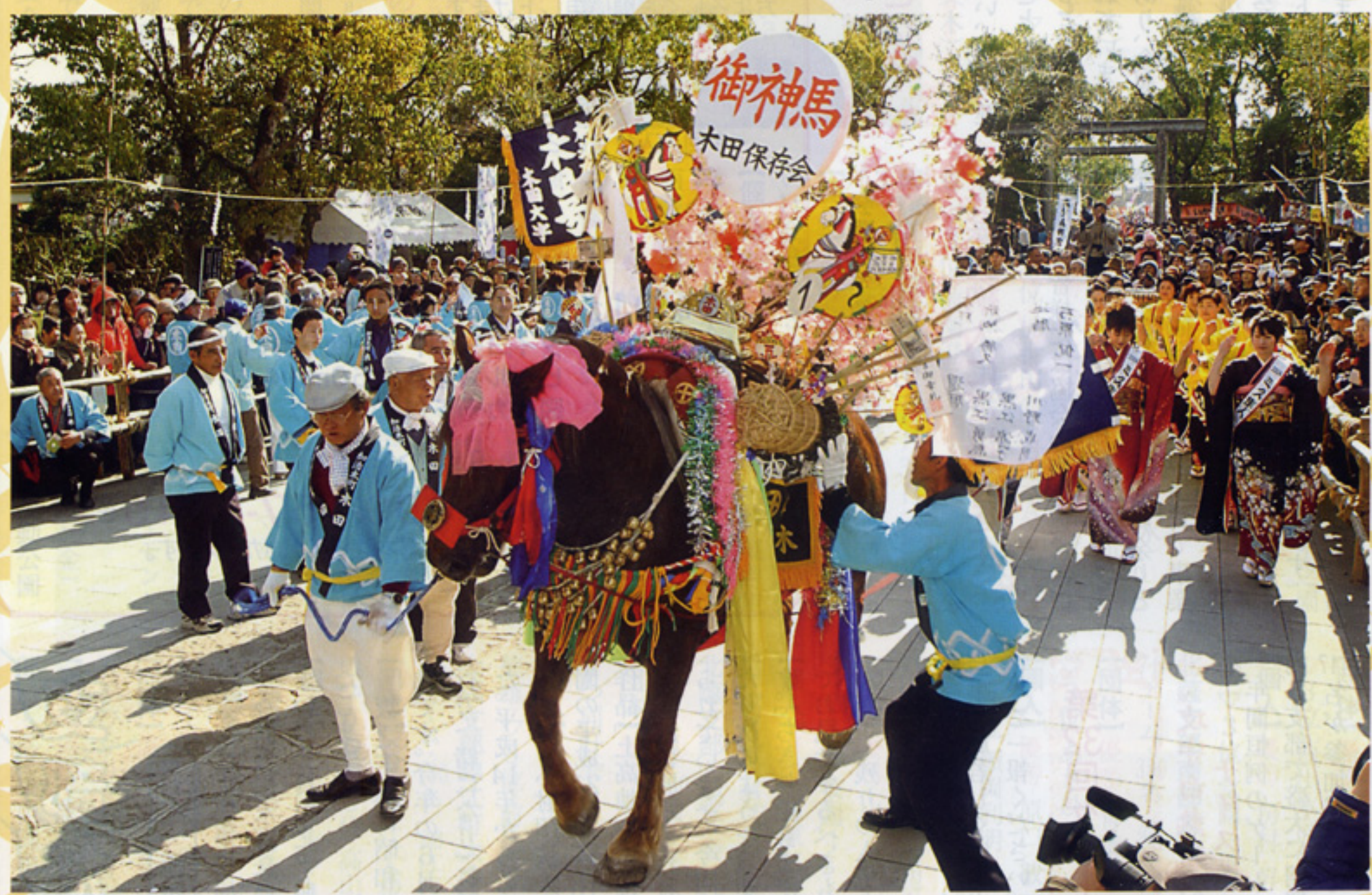
霧島市 隼人 「初午祭」

〒890-0055鹿児島市上荒田町23-21 TEL FAX 099-257-8445 http://www.k-nenkin.com