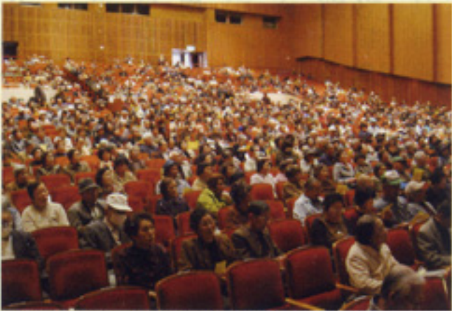
会場もいっぱい 鹿児島支部宝山