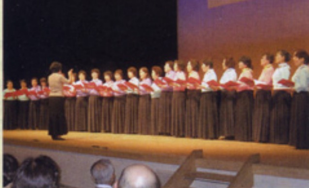
コーラス コール隼人 北薩支部