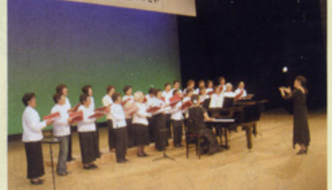
コーラス「コールたんぼぼ」 大隅支部