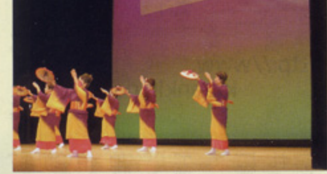
踊り「花笠音頭」 北薩支部