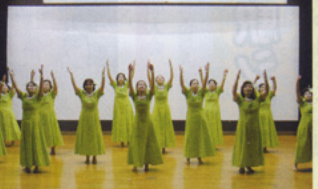
洋舞 ロイヤルフラダンス 奄美大島支部