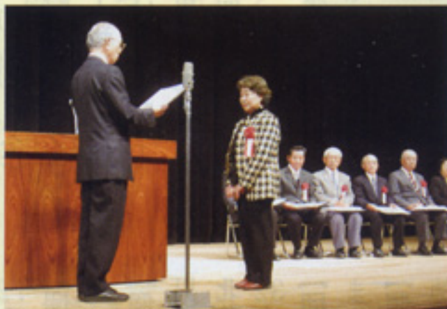
功労者会長表彰 受賞者33名