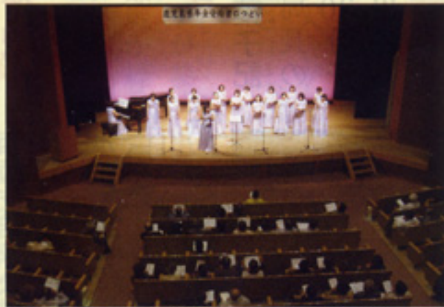
「みんなで一緒に歌いましょう！」 フローレス・ポーチェ会 西薩支部