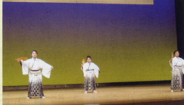
「祝賀の舞」三喜流 大隅支部