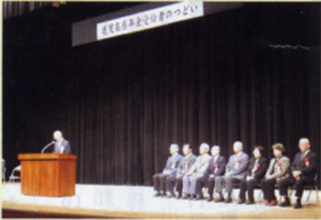
会長挨拶 鹿児島支部宝山

最後は、みんなで懐かしの唱の大合唱などもあり、最後まで大変な盛り上がりとなりました。