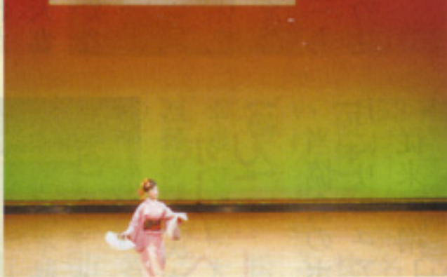
踊り「落葉の踊り」 西薩支部