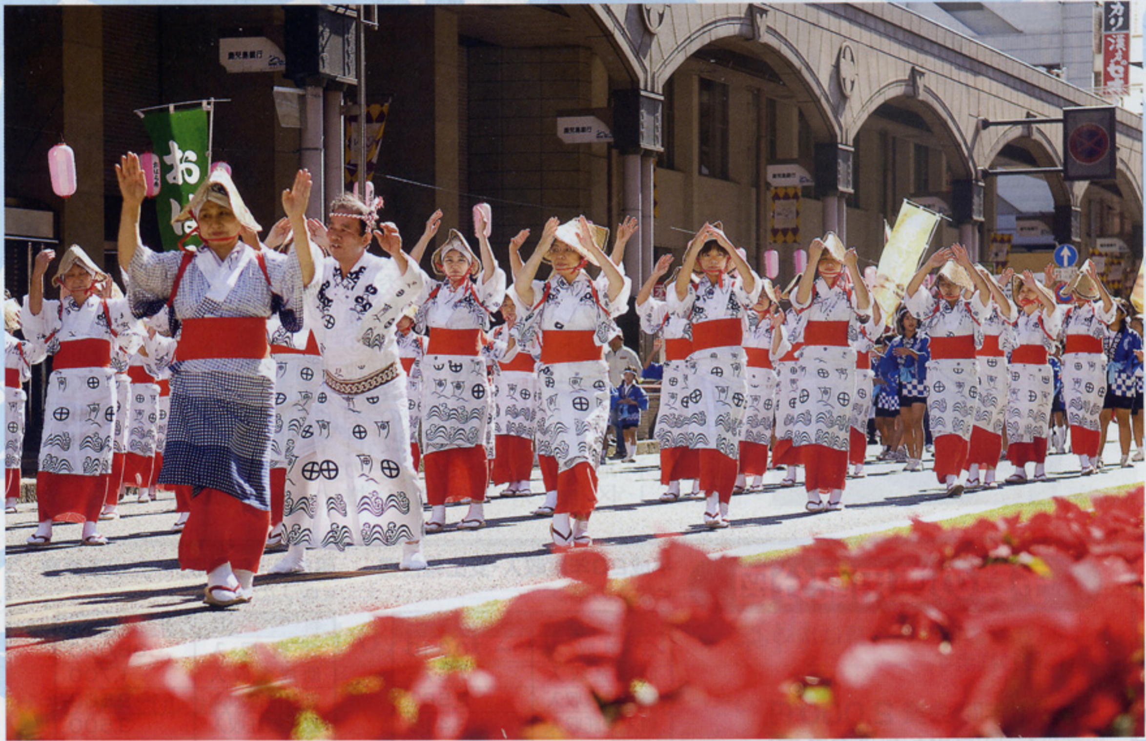
「鹿児島市 おはら祭り」

〒890-0055鹿児島市上荒田町23-21 TEL FAX 099-257-8445 http://www.zenkouren.or.jp/todofuken/td_46ks.html